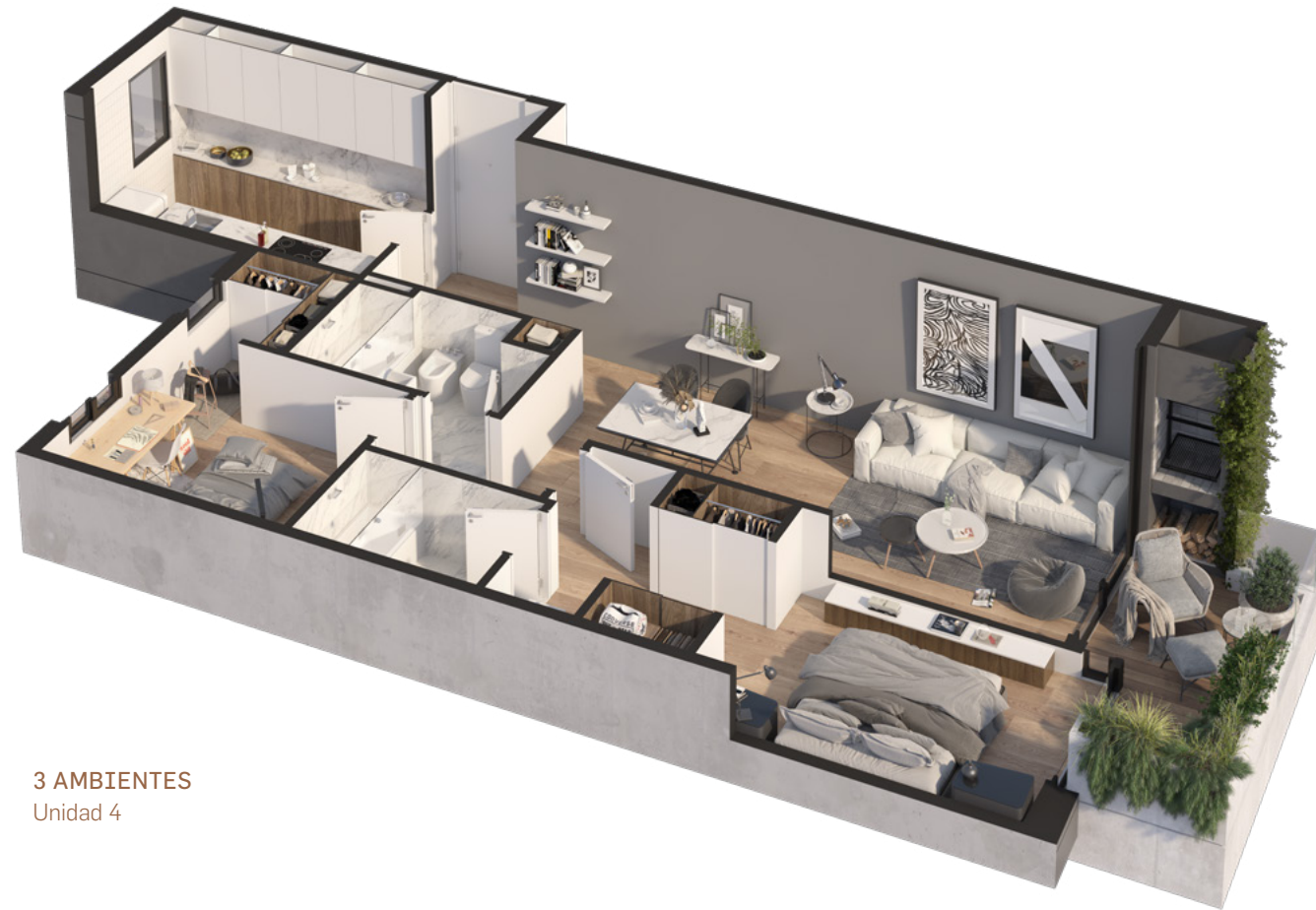
3 AMBIENTES Unidad 4